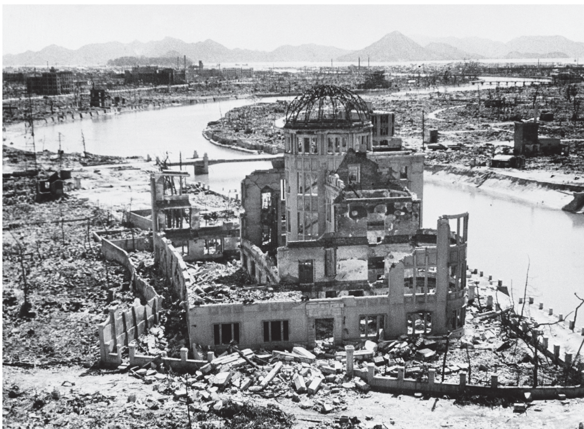
Hiroshima op 1 september 1945 – UN Photo # 84769