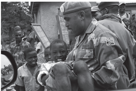
MONUC peacekeeper plays with village children in Ntamugenga, DRC

civilians under imminent threat of physical violence. Even then, concerns continued to be raised at its limited mandate, resources, international political backing and resolve. 20