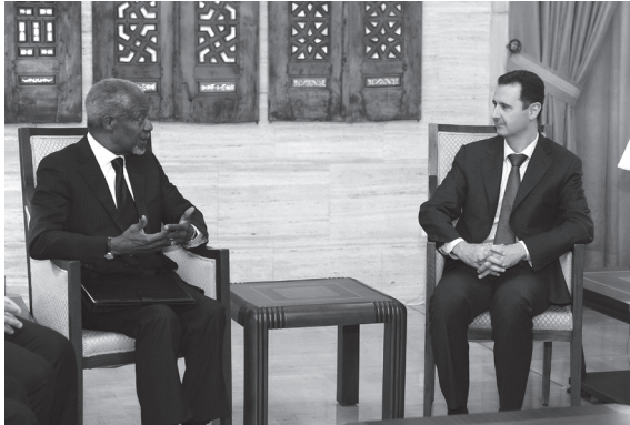
Speciale Gezant voor Syrië, Kofi Annan, ontmoette de Syrische President Bashar al-Assad in Damascus op 10 maart 2012

een onderdrukte soennitische gemeenschap versus een totalitair regime is de complexiteit negeren en is nefast zo men een veralgemeende burgeroorlog wil vermijden.