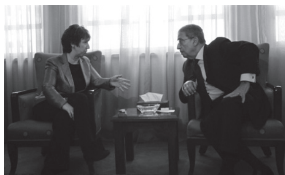
Hoge Vertegenwoordiger van de EU Catherine Ashton ontmoette de Secretaris-generaal van de Arabische Liga Amr Moussa op 14 maart 2011 in Caïro

De samenwerking tussen de EU en andere regionale multilaterale organisaties - de Afrikaanse Unie (AU), de Liga van Arabische Staten (Arabische Liga), de Organisatie van de Islamitische Samenwerking (OIC), en de Samenwerkingsraad van de Arabische Golfstaten (GCC) – kende een verschillende diepgang. Bijzonder opmerkelijk is de toenadering van de EU tot de Arabische Liga. Deze organisatie, in 1945 in Caïro opgericht met 6 lidstaten op voorstel van Egypte, bestaat inmiddels uit 22 landen en omspant daarmee zowat de hele Arabische wereld. Voorafgaand aan de omwentelingen gold zij vooral als een club van autocratische leiders met weinig legitimiteit. Onder leiding van Secretaris-generaal Amr Moussa ontwikkelde deze zich in het voorjaar van 2011 tot een pleitbezorger van de demonstranten in de Arabische wereld. Na het aandringen van de Liga bij de Veiligheidsraad om een vliegverbod boven Libië in te stellen, haar actieve diplomatie in de regio en de schorsing van lidstaten Libië en Syrië, kan er dan ook gesproken worden over het 'ontwaken van de Arabische Liga'. 16