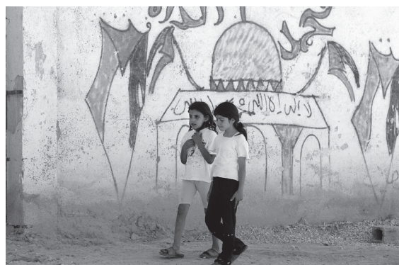
Twee Palestijnse meisjes lopen langs een graffiti muur op de Westelijke Jordaanoever