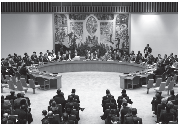
De VN-Veiligheidsraad in sessie

dan natuurlijk wel gebaseerd zijn op hoofdstuk VII van het VN-Handvest aangezien alleen resoluties onder hoofdstuk VII bindend zijn. Ook artikels 24 en 103 van het VN-Handvest zijn hier van belang. Artikel 24 stelt de primaire verantwoordelijkheid van de VN voor de handhaving van de internationale vrede en veiligheid. Artikel 103 vermeldt dat “in geval van strijdigheid tussen de verplichtingen van de leden van de Verenigde Naties krachtens dit Handvest en hun verplichtingen krachtens anders internationale overeenkomsten, hebben hun verplichtingen krachtens dit Handvest voorrang”. 26 In andere woorden, een resolutie aangenomen door de VN-Veiligheidsraad onder hoofdstuk VII zal dus voorrang hebben op de verplichtingen van staten krachtens andere internationale overeenkomsten, i.e. het bezettingsrecht bijvoorbeeld.