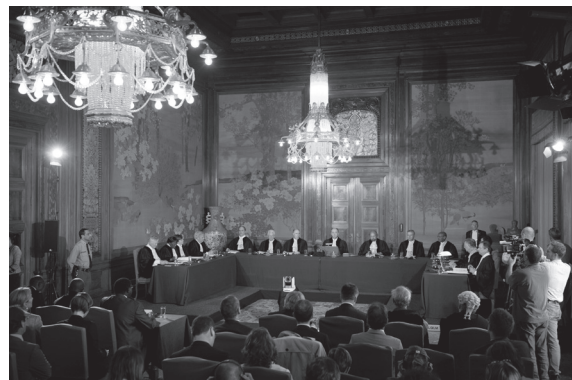
De beslissing van het IGH in de zaak België v. Senegal werd voorgelezen in de Japanse Zaal van het Vredespaleis op 20 juli 2012

België stelde dat Senegal haar verplichtingen voortvloeiend uit het VN-Folteringsverdrag, die beide landen geratificeerd hebben, geschonden heeft. Den Haag bleek de argumenten van de Belgische pleiters genegen te zijn. Het Hof besliste dat de lakse houding van de Senegalese autoriteiten niet te verzoenen viel met haar verdragsrechtelijke verplichtingen, onder meer de plicht om onmiddellijk een preliminair onderzoek in te stellen en Habré voor de bevoegde instantie te brengen met oog op de vervolging. Senegal riep onder andere als verweer in de belangrijke financiële implicaties (laten overbrengen van getuigen, bewijsvergaring, enz.) die gepaard gaan met een dergelijk proces. Dit argument wist de rechters niet te overtuigen en doet bijgevolg geen afbreuk aan voornoemde verplichtingen. Bovendien had Dakar tegen november 2010 steun gekregen van internationale donors ter waarde van 8.6 miljoen € waarvan 1 miljoen € door België geschonken). De slotsom: Senegal dient "onverwijld" Habré te vervolgen of uit te leveren. In de context van de zaak dient vermeld te worden dat de nieuwe president van Senegal heeft bevestigd dat de zaak kan plaatsvinden in zijn land en dat Brussel justitiële samenwerking en verdere financiering van het proces heeft aangeboden.