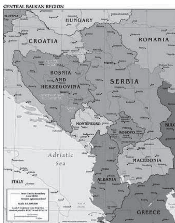
Kaart van de regio

Vandaag wordt de geschiedenis van Kosovo verder geschreven. Drie opmerkelijke gebeurtenissen in de maanden juni en juli van 2012 hebben wellicht een nieuw hoofdstuk ingeluid, een met meer Europese tinten.