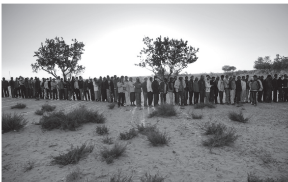
Libyan refugees queue for food at Tunisia Transit Camp, March 2011

A United Nations report has criticized the Gaddafi regime, the anti-Gaddafi forces and the North Atlantic Treaty Organisation (NATO) for causing