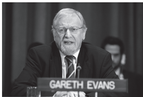
Gareth Evans, former Minister for Foreign Affairs of Australia and Co-Chair of the International Commission on Intervention and State Sovereignty (ICISS), participates in an informal interactive dialogue of the General Assembly on the responsibility to protect

hesitation and hostility, R2P is gaining increasing resonance worldwide.