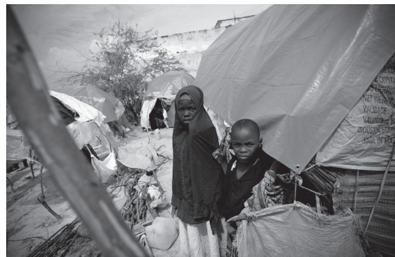
Somali children at a camp for Internally Displaced Persons (IDPs) in Mogadishu, July 2011

Increasingly on the receiving end from the growing insurgency, the combined Ethiopian, UN sanctioned AU Mission in Somalia (AMISOM) and Transitional Federal Government (TFG) forces have failed to establish control and security in the country. Previous UN efforts in Somalia, the UN Operation in Somalia (UNOSOM I and II, 1992-1993 and 1993-1995, respectively) and the US led and UN sanctioned Unified Task Force (UNITAF, 1992-1993), undertaken to monitor the ceasefire, establish a secure environment for humanitarian assistance and restore peace, stability, and security, were withdrawn before they could accomplish their missions or fulfill their mandates. The recent Kenyan military intervention in southern Somalia, like the constant military interventions of Ethiopia, is unlikely to bring about an improvement of the country's security situation and the human condition of the Somali civilian population.