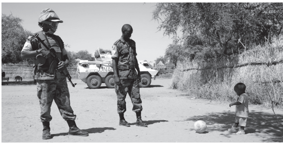
UNAMID peacekeepers patrol in Northern Darfur while a child plays with a soccer ball

The AU High-Level Implementation Panel for Sudan (AUHIP) chaired by former South African president Thabo Mbeki, the joint mediation efforts by the AU and the UN headed by AU-UN Chief Mediator Djibril Bassolé and coordinated international support through the Sudan Consultative Forum to help resolve the conflict in Darfur and promote durable peace within and between the Republic of Sudan and independent South Sudan have yet to deliver. Further, the resurgence of heavy fighting in South Kordofan and Blue Nile and the recent surge of violence in Darfur continue to victimize the civilian populations in these regions with massive violations of human rights verging on war crimes and crimes against humanity.