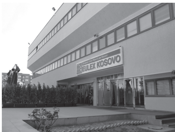
Het EULEX hoofdkwartier in Kosovo

Eén dag nadat Kosovo de roadmap to visa liberalisation mocht ontvangen, werden op 15 juni 2012 het mandaat en de nieuwe structuur van 'EULEX 2.0' van kracht. De rechtsstaatmissie van de Europese Unie in Kosovo (EULEX) 10 werd door de Raad van de Europese Unie 11 verlengd voor een nieuwe periode van twee jaar, tot 14 juni 2014, en zou tevens een nieuwe structuur aannemen. De Missie bestaat niet langer uit drie componenten (justitie, politie en douane), maar uit twee divisies (een uitvoerende en een versterkende) verwijzende naar de twee elementen van het EULEX mandaat. 12 Bovendien werd de Missie ook in omvang afgeslankt met ongeveer 25% en werken er momenteel zo'n 1250 politiefunctionarissen, rechters, aanklagers en civiele experts en 1.000 lokale werknemers.