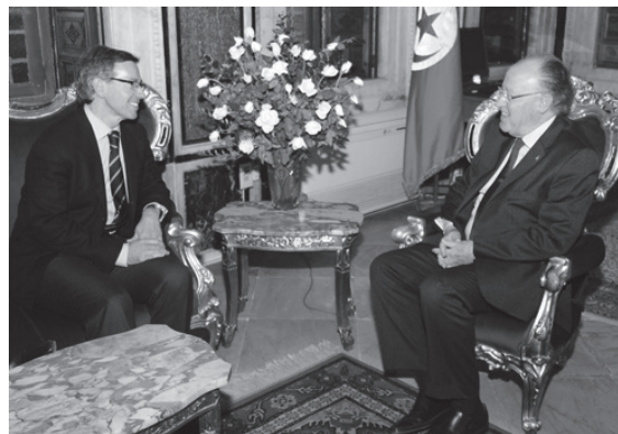
Ontmoeting tussen de Speciale Vertegenwoordiger van de EU voor het zuiden van het Middellands Zeegebied Bernardino Leon en Mustapha Ben Jaafar, Voorzitter van de Nationale Grondwetgevende Vergadering van Tunesië op 10 december 2011

zich meebracht werd door Westerse mogendheden verkozen boven de onvoorspelbare uitkomst van politieke hervormingen. Bovendien werd stabiliteit in de Arabische wereld gezien als de beste bescherming tegen radicalisme en illegale migratie. Zo hadden de Arabische landen en de Unie een gezamenlijk belang bij het beheersen van het risico van terrorisme in de MENA: de Arabische leiders zagen terrorisme als een bedreiging voor hun eigen regimes en waren geheel bereid om akkoorden af te sluiten met de EU ter bestrijding van dit kwaad. Tunesië, bijvoorbeeld, heeft in de nasleep van 9/11 zeer effectief samengewerkt met de EU. Dat de Tunesische terrorismewetten de verplichtingen van het land onder internationaal recht schonden, zoals onder de aandacht gebracht door internationale ngo's, vormde nooit een breukpunt voor de EU. 9 Europa creëerde een zekere dubbelzinnigheid in haar relatie met autoritaire regimes, en de nagestreefde stabiliteit was daardoor verre van duurzaam.