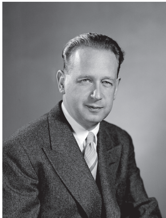
Dag Hammarskjöld, de tweede Secretaris-generaal van de VN, in 1953

huurlingen. Deels lijkt de informatie uit het boek zo uit een spionageroman van Graham Greene te komen, maar de onderzoekster baseert zich op gedegen historisch onderzoek. Ze werkte verschillende jaren aan dit boek, ze consulteerde mensen in Zambia, vele archieven en bibliotheken en ze sprak met forensische, ballistische en medische experts. Cruciaal is ondermeer het gebruik van de persoonlijke archieven van Sir Roy Welensky, Eerste Minister van de Centraal-Afrikaanse Federatie (bestaande uit Noord- en Zuid Rhodesië en Nyasaland) tussen 1957 en 1963. Deze archieven bevinden zich aan de Universiteit van Oxford en dit geklasseerd materiaal werd voor het eerst door een onderzoeker geconsulteerd. Zo zou het lichaam van Hammarskjöld een schotwonde bevatten en worden bewijzen aangehaald dat een tweede vliegtuigje het vliegtuig van de Secretaris-generaal neerhaalde.